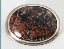
Sabine Oberer-Cetto Brosche Jaspis, 925 Silber Erstgebot € 150,-