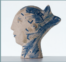
Bernd Altenstein Fischkopf Ton gebrannt H 26 B 25 Erstgebot € 650,-