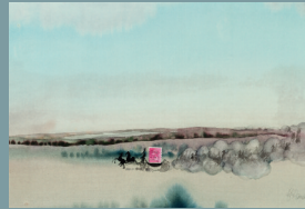
Hans Georg Rauch Königliche Ausfahrt Aquarell, frankiert H 40 B 55 Erstgebot € 490,-