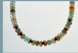
Dagmar Kück Halskette Opal Gold Erstgebot € 250,-