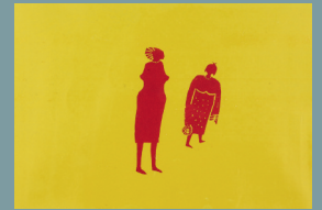
Heini Linkshänder Siebdruck Afrika, Afrika H 70 B 99 Erstgebot € 250,-