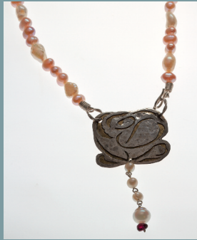
Regine Blome-Weichert Collier Süßwasser-Perlen 935 Silber Erstgebot € 180,-